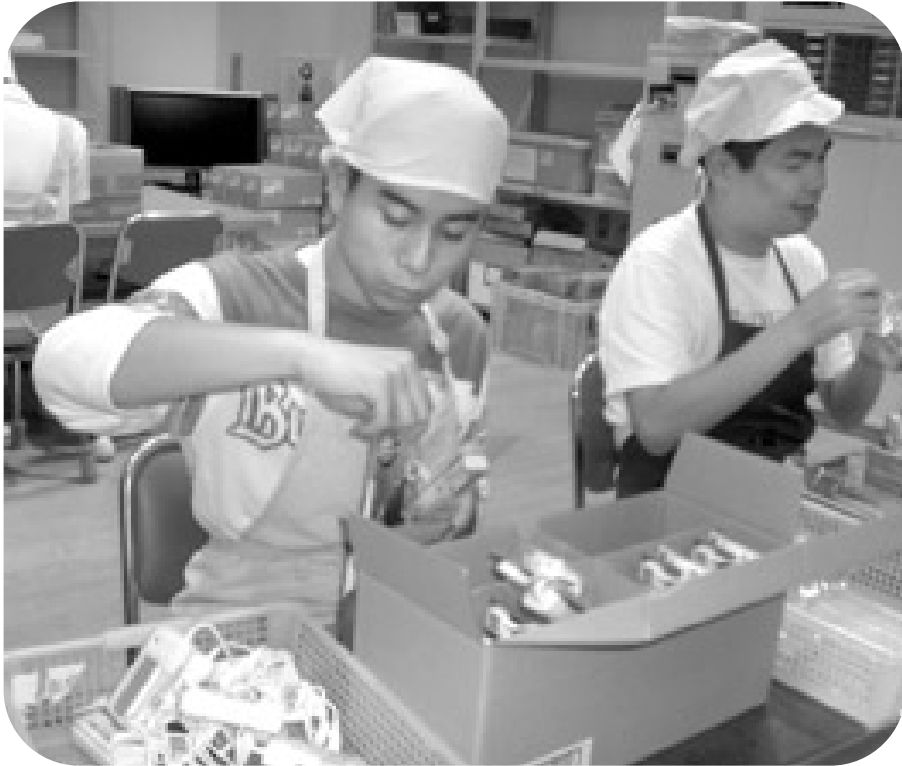
携帯電話の充電器作業。パッケージから本体を取りだしています。