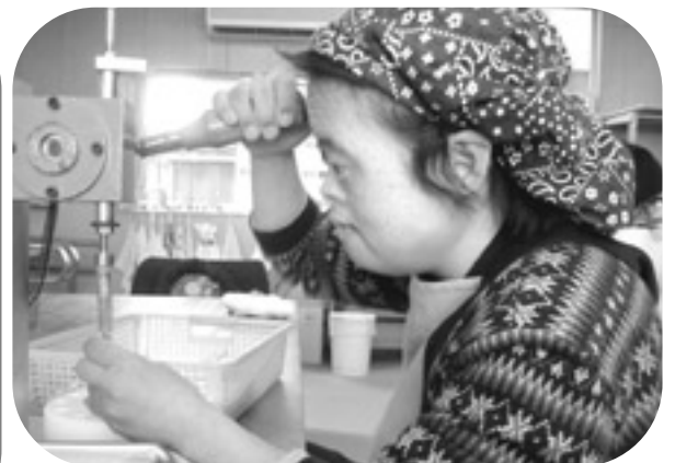
ボールペンの組立て作業で、キャップを閉めようとしている所です。