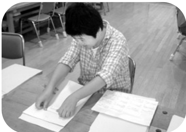
封筒に宛名を貼る作業。真っすぐ貼れるように枠を作り、枠に沿ってシールを貼っています。