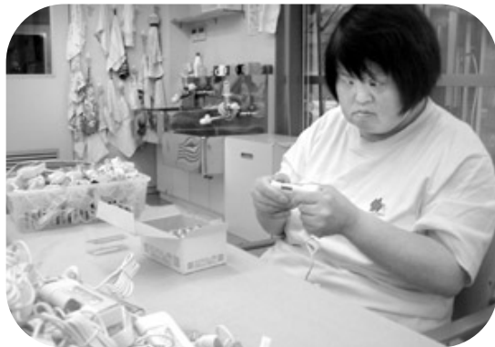
充電器に電池を入れています。みんなで作業をすると、1時間で1,200個も完成します。